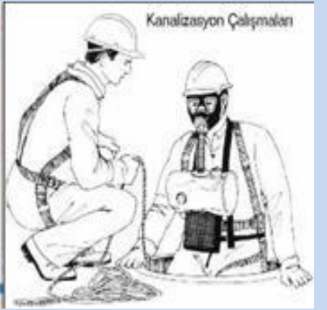
Uygun kıyafet kullanımı