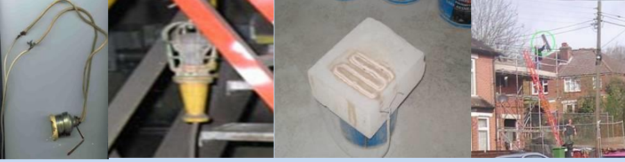
İptidai seyyar lamba Uygun seyyar lamba İptidai ısıtıcı