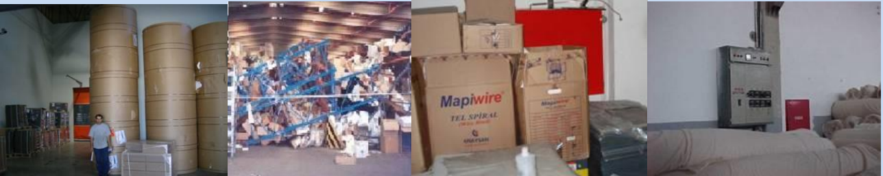
İstif yüksekliği fazla Devrilmiş istif Yangın dolabı ve elektrik panosunun önü istifle kapatılmış